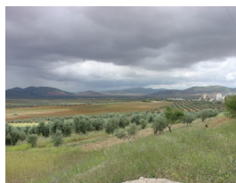
Geología y paisaje de los Montes de Toledo centro-orientales.

8:15-18:30. Excursión pre-Bienal. Montes de Toledo centro-orientales